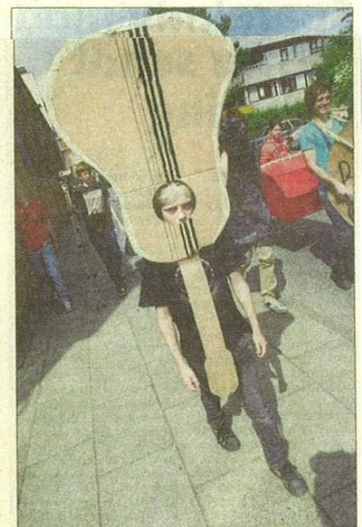
På Bifrost udfolder børnene sig både kunstnerisk og musikalsk, og nogle af børnene slår to fluer med et smæk. En gruppe havde lavet et orkester.